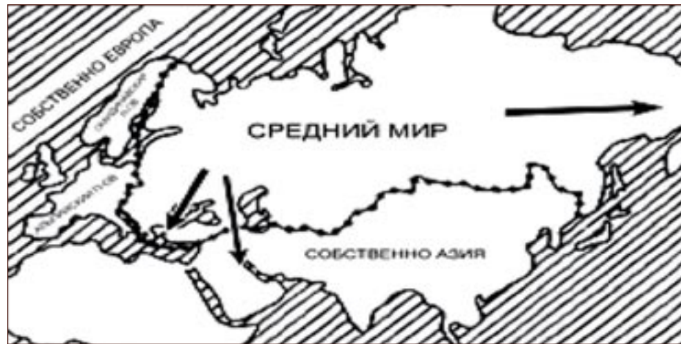
Carta 1. Raffigurazione dei tre mondi del continente asiatico-europeo: l'Europa propriamente intesa, il Mondo di mezzo, l'Asia propriamente intesa (LAMANSKIJ 1892). Il mondo greco-slavo confina con il mondo romano-germanico da Danzica a Trieste e include, oltre all'Europa orientale e ai Balcani, Costantinopoli, Asia Minore e parte della Siria.

La visione di Sergej M. Solov'ëv (1820-1879) subordina i processi di sviluppo socio-politico alle peculiarità geomorfologiche dei singoli Paesi. Assumendo i confini acquatici dell'Impero zarista, dal Baltico al Mar Nero, come la linea naturale di demarcazione tra il mondo slavo e i popoli vicini, egli è il primo a individuare nei Balcani e nel Vicino Oriente la principale area di frizione tra la Russia e l'Europa, intese come due civiltà in competizione, fondate su sistemi valoriali antitetici.