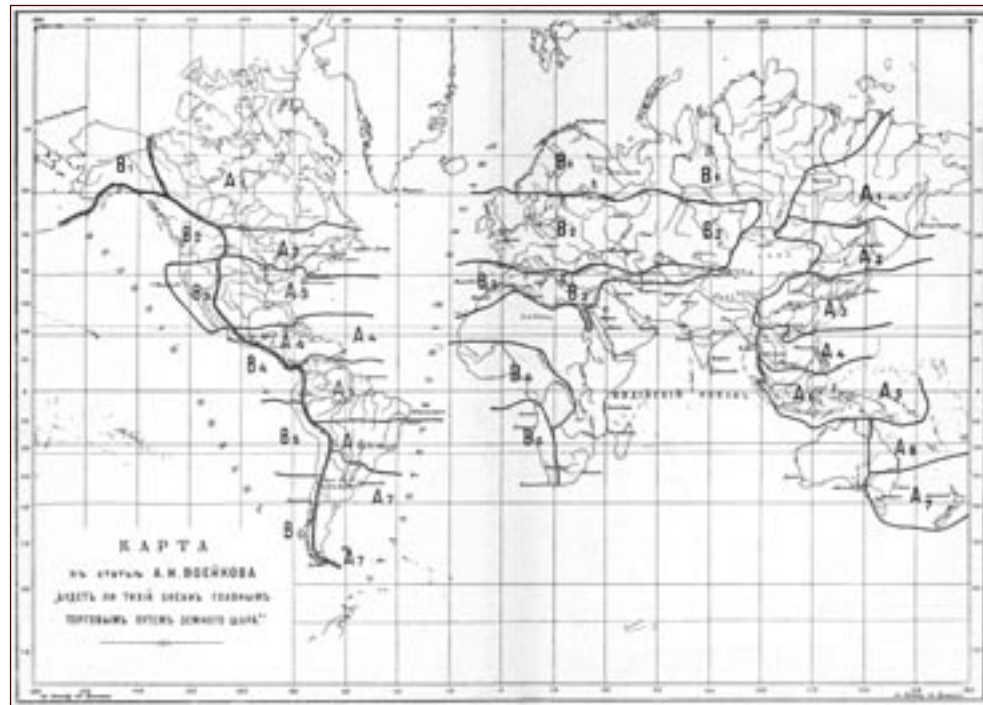
Carta 2. La zonizzazione dei bacini commerciali e le rotte dell'interscambio globale (Voejkov 1904).

Nel 1904, pochi mesi dopo la relazione di Mackinder sul “perno della storia”, il geografo e climatologo Aleksander I. Voejkov (1842-1916) pubblica il saggio Sarà l'Oceano Pacifico la principale rotta commerciale del globo? 10 . Egli individua due macroregioni cardine dell'interscambio internazionale 11 , i cosiddetti “bacini commerciali orientale e occidentale”, coincidenti con gli oceani Pacifico e Atlantico. Includendo nel “bacino occidentale” il Mar Caspio e il Lago d’Aral, lo studioso indaga le prospettive per il commercio mondiale dopo la ripresa dei lavori del Canale di Panama, in specie le ricadute sulla “Grande via transiberiana”. Per Voejkov la creazione di questo corridoio di transito e il suo allacciamento con le rotte economiche tra Europa e Asia va rivolto anzitutto allo sviluppo della Siberia, per farne l'avamposto della proiezione nel Pacifico; poiché è in Eurasia la chiave per valorizzare il potenziale russo tout-court .