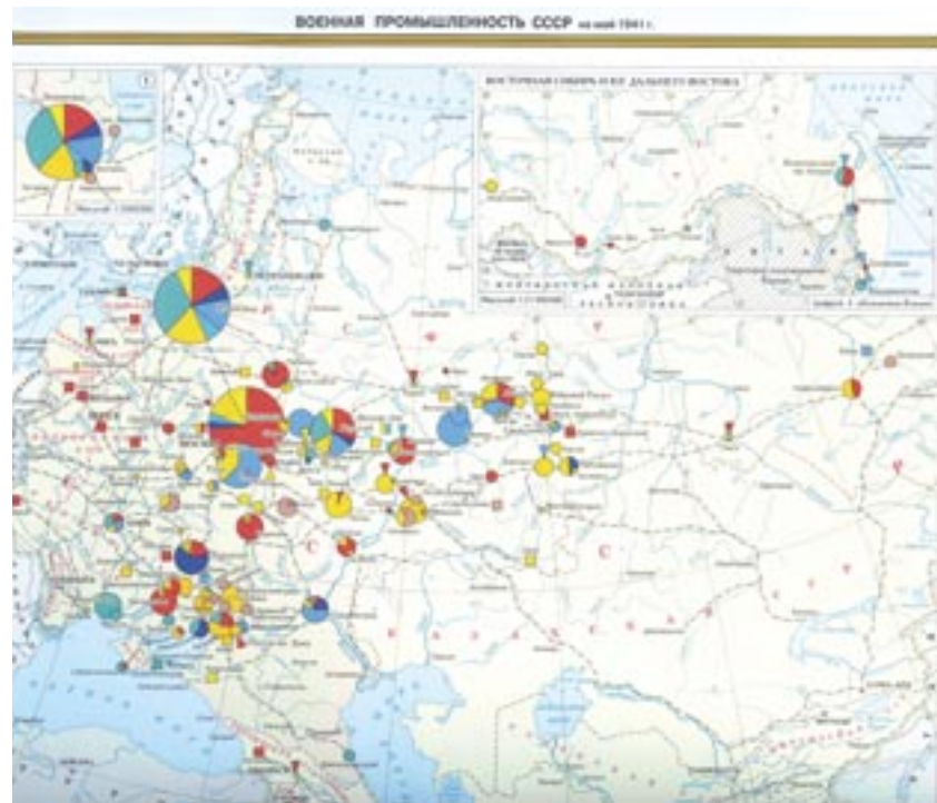
Carta 6. I centri chiave del complesso militar-industriale sovietico: situazione a maggio 1941 (MAKSIMOV 2003, p. 249).

le accademie reintroducono le vecchie denominazioni di “statistica militare” e “geostrategia”. Il rapporto tra queste scienze e il totalitarismo staliniano resta questione aperta. Se alcuni studiosi occidentali vedono nel modello che forgia la grande strategia una forma di globalizzazione, un fenomeno nuovo e originale che coniuga linguaggi alternativi della modernità 34 , vari storici russi oggi parlano apertamente di “geopolitica”. Peraltro lo stesso Stalin, nella summa Breve corso di storia del Partito Comunista bolscevico dell'Urss 35 , illustrando il rapporto tra geografia e marxismo-leninismo, precisa cosa debba intendersi dal punto di vista del materialismo storico per «condizioni materiali di vita della società», quelle che in ultima analisi forgianno la società, le sue idee e visioni, le istituzioni politiche 36 . Al contrario di Hitler, che ideologizza la Geopolitica in chiave razziale, Stalin sembra rifarsi a una lettura geopolitica del leninismo, tesa a recuperare la sovranità