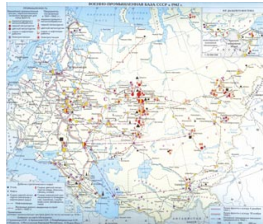
Carta 7. I centri chiave del complesso militar-industriale sovietico: situazione nel 1942 (MAKSIMOV 2003, p. 303).

come fondamento della statualità. Essa ha inizio con il corso del Socialismo in un solo Paese e si evolve sul piano internazionale in un modello misto, «portato a compimento durante la seconda rivoluzione staliniana, che rappresenta una sintesi delle tradizioni imperiale e rivoluzionaria, entrambe mescolate fin da principio con retaggi russi e occidentali» 37 . Tale commistione riconduce l'Urss allo spazio geopolitico e geoculturale da cui originò lo Stato russo, l'Eurasia, al crocevia di molteplici civiltà, che diventa la chiave di volta dell'identità statale sovietica. A Oriente la guerra di frontiera del 1938-1939 palesa l'efficacia del nuovo paradigma. Grazie al vantaggio della continuità territoriale l'Armata rossa arresta l'espansione nipponica in Mongolia sventando le velleità imperiali di Tokyo sulla “direttrice nord”. L'Occidente non coglie a pieno il cambio dei codici geopolitici. L'Europa guarda all'Urss come un relitto della potenza zarista e sfida il “colosso dai piedi d'argilla”. L'invasione hitleriana sposterà il pendolo dello sviluppo sovietico ancora più a est 38 . Al termine del conflitto mondiale la vittoria sul Giappone è prodromica al trionfo sovietico in Cina e decreta la superiorità del sistema continentale “da mare a mare” sia rispetto al “sistema ad anello” nipponico che all’“arcipelago imperiale” britannico.