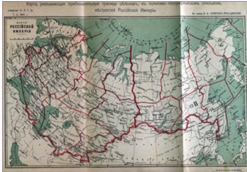
Carta 4. La suddivisione politico-geografica dei confini interni ed esterni dell'Impero zarista (SEMĖNOV-TJAN-SHANSKIJ 1915).

Tale concezione fa proprio l'orizzonte eurasiatico di Vandam ma è antitetica al modello marittimo. La rappresentazione dell'Impero zarista è centrata sulla dimensione terrestre, assunta come il fattore strategico che ha assicurato alla Russia la continuità dell'inse-diamento territoriale fino al Pacifico, un'espansione transcontinentale via terra, da un mare all'altro, tratto peculiare dell'avanzata coloniale slava a est.