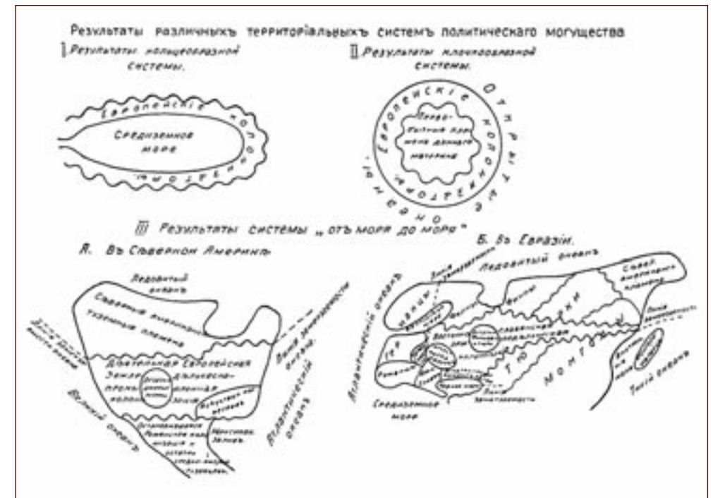
Carta 3. I tre sistemi di dominio territoriale: “ad anello”; “ad arcipelago”; “da mare a mare”; a. America settentrionale, b. Eurasia (SEMËNOV-TJAN-SHANSKIJ 1915).

studi pionieristici di geoeconomia e geografia umana 12 . Nel 1912 presenta la relazione Sulle forme dei più potenti possedimenti territoriali in rapporto alla Russia 13 , che enuclea una visione propriamente “terrestre”, alternativa ai modelli fondati sulla dimensione oceanica o sul potere navale: il cosiddetto “sistema continentale da mare a mare”.