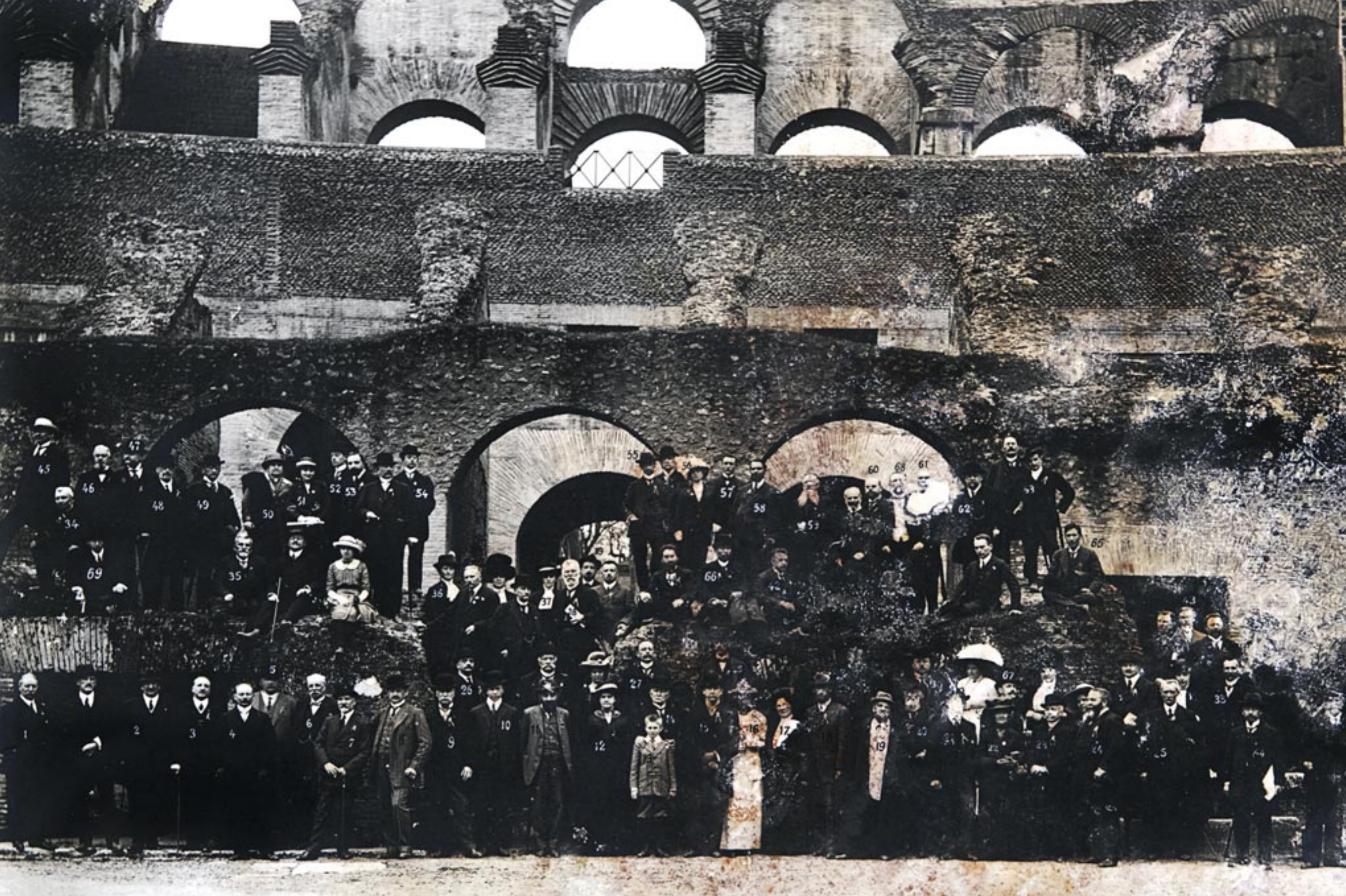
Veniamin Petrovich Semënov-Tjan-Shanskij coltiva contatti con l'ambiente scientifico anche al di fuori della Russia. Qui è ritratto, indicato con il numero 48 (come si vede in dettaglio nell'immagine della pagina successiva), tra i partecipanti al X Congresso Geografico Internazionale tenutosi a Roma nel 1913, dove assunse la carica di vicepresidente. Fotografia eseguita il 12 aprile 1913 all'interno del Colosseo.