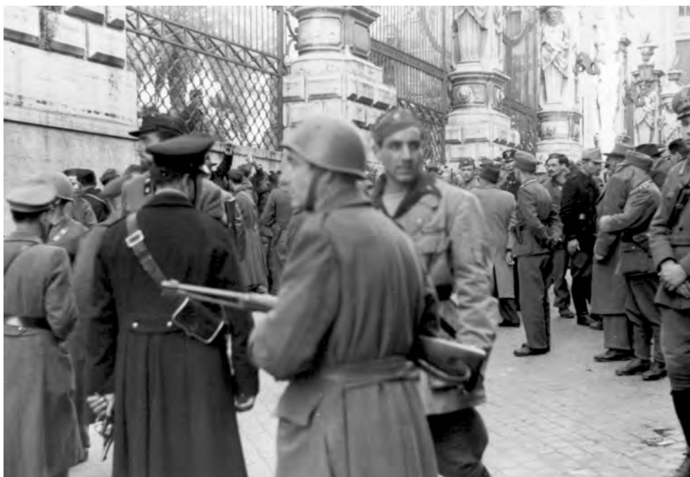
Retata di civili da parte di soldati italiani collaborazionisti e occupanti tedeschi dopo l'azione partigiana di via Rasella a Roma il 13 marzo 1944.