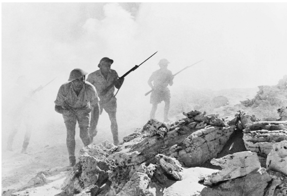
Soldati australiani a El Alamein.

Fu in quel momento che gli americani e gli inglesi compresero dove si celava la loro falla. Le informazioni riservate, che fino ad allora erano state intercettate con sorprendente facilità, stavano compromettendo seriamente le operazioni alleate. Il Signal Intelligence Service – la sezione dell'Esercito statunitense dedicata alla decifrazione dei codici – intervenne con prontezza, inviando al Cairo la nuova macchina cifrante, la Ecm Mark II, nota con il nome di Sigaba. Realizzata dal crittografo americano William Friedman nel 1935, era somigliante a Enigma ma ne superava brillantemente le debolezze. Con l'introduzione di questo sofisticato dispositivo, il vecchio sistema di codifica Black Code divenne improvvisamente inutilizzabile. Le comunicazioni alleate tornarono a essere sicure, e con esse cambiò anche il corso della guerra nel Nord Africa. Da quel momento, il vantaggio informativo che aveva favorito Rommel e l'Afrikakorps iniziò a svanire, segnando l'inizio di una nuova fase del conflitto.