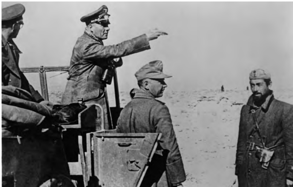
Il generale Johannes Erwin Eugen Rommel (1891-1944) in Nord Africa agli inizi del febbraio 1942.

anche da Galeazzo Ciano, ministro degli Esteri e genero di Benito Mussolini, che nel suo diario, alla data 30 settembre 1941, scrisse: «[...] il Sim è venuto in possesso del cifrario segreto americano e tutto quanto Phillips [William Philips, ambasciatore americano a Roma dal 1936 al 6 ottobre 1941] telegrafa, viene letto dai nostri uffici di decrittazione [...]» (CIANO 2020, p. 618).