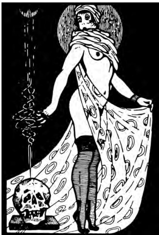
Illustrazione di Carlo H. De' Medici da I topi del cimitero , Cliquot, Roma 2019, p. 128. Per gentile concessione della casa editrice Cliquot.

Le sue aree politiche di competenza appaiono essere il movimento comunista e il nazionalismo sloveno, con una particolare attenzione alle popolazioni slave della Venezia Giulia, dove covava maggiormente l'odio antifascista. Le sue spiate servirono spesso a cogliere sul nascere prudenti convergenze e nascenti simpatie di molti giovani verso le organizzazioni