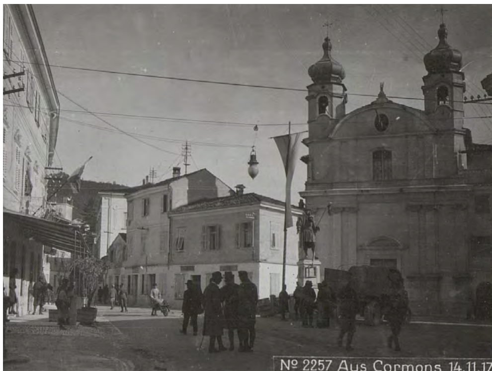
Cormons in una fotografia del 14 novembre 1917 durante l'occupazione austriaca (Österreichische K.u.k. Kriegspressequartier, Lichtbildstelle – Wien / Nationalbibliothek – Austrian National Library / Wikimedia Commons).

citò un controllo particolarmente attento sulle organizzazioni clandestine comuniste, sulle popolazioni allogene di origine e cultura slovena e sugli ambienti tradizionalmente legati ancora alla cultura austriaca. I ceti sociali che controllava erano molto vari, si andava da quelli popolari di Gorizia alle popolazioni allogene slave predominanti a est di Gorizia, agli aristocratici di cultura e lingua austriaca di Cormons, gli “austriacanti”, come egli spesso li definisce, un ambiente «chiuso ma vasto», «data la grande quantità di nobili austriaci residenti in Venezia Giulia». Come, ad esempio, il conte Alessio Coronini Kromberg, che, nella sua tenuta di Sampietro di Gorizia, ospitava «per lunghi periodi di tempo nobili austriaci della provincia o giunti dall'estero». Proprio in quel periodo, il conte ospitava il barone Viktor-Eugen Frolichsthal, ex consigliere dell'ex cancelliere austriaco Kurt Alois von Schuschnigg. Nel suo salotto si criticava «aspramente il nazionalsocialismo e il Regime Fascista», con la speranza di una «non lontana ricostituzione dello stato austriaco indipendente».