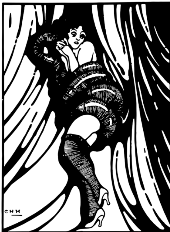
Illustrazione di Carlo H. De' Medici da I topi del cimitero , Cliquot, Roma 2019, p. 78.

Lo scoppio della guerra, con l'invasione della Polonia da parte della Germania, rappresentò per De' Medici l'inizio di un'attività frenetica di controllo delle popolazioni slave residenti nel territorio goriziano. Era del resto il compito che i vertici dell'Ovra avevano affidato alla rete spionistica sul territorio: sondare gli umori del Paese nella prospettiva di